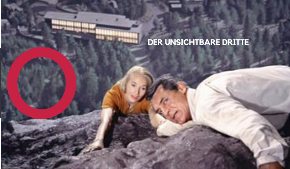
DER UNSICHTBARE DRITTE