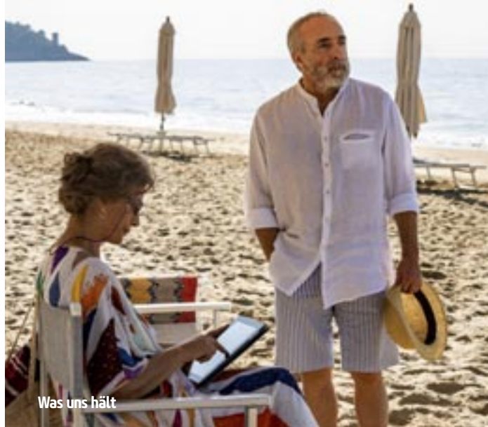
Was uns hält