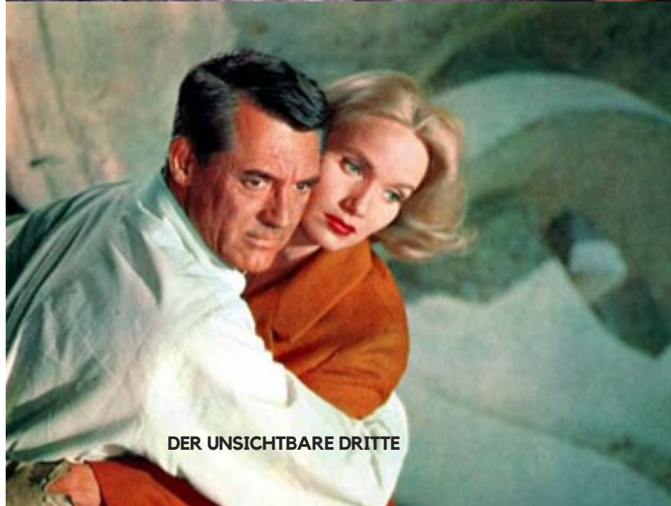
DER UNSICHTBARE DRITTE

Filmreihe siehe Programmübersicht. wird im August fortgesetzt